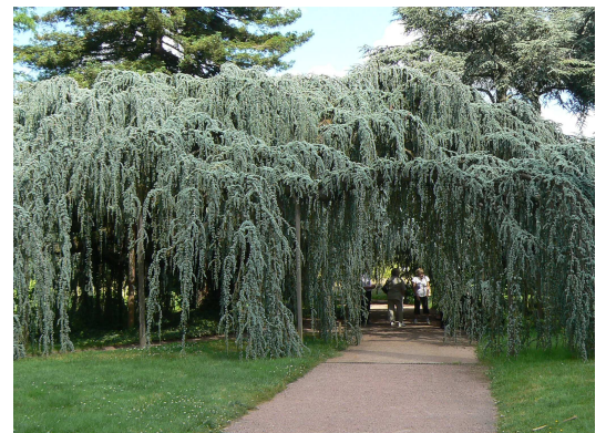
Cèdre bleu pleureur